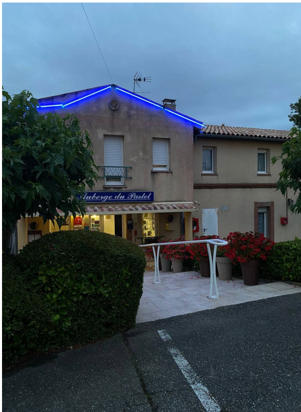
Auberge du Pastel